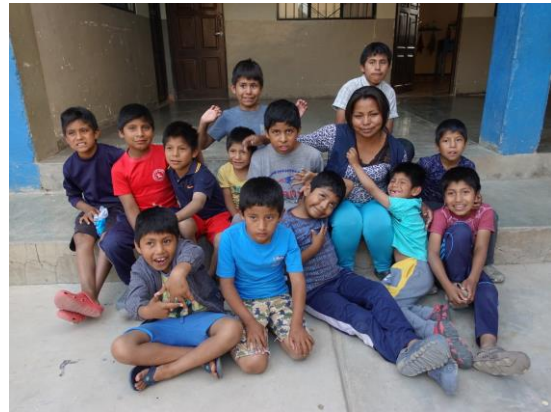
Trivsamt familjemiljö på pojkhemmet El Arca och flickhemmet Rosa de Sarón gör att barnen upplever omsorg och trygghet.

Barnens RäddningsArks huvudsakliga verksamhet är att hjälpa unga flickor och pojkar som ligger i högriskszonen för att börja leva på gatan eller som redan börjat leva på gatan, till en framtid genom rehabilitering, skola och yrkesutbildning. Genom en långsiktigt utarbetad plan får barnen den hjälp de behöver för att komma in i ett fungerande liv i det bolivianska samhället och slutligen klara sig själva.