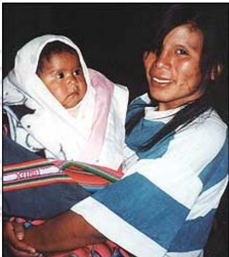
Ung mor med barn.