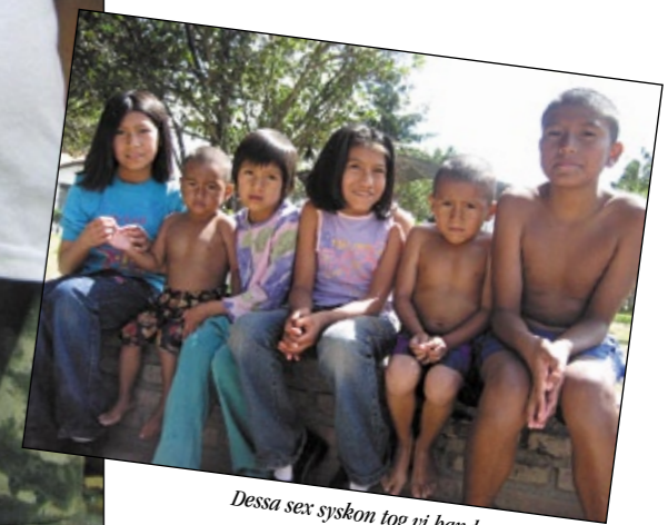
Dessa sex syskon tog vi hand om förra året.

Vi är verkligen tacksamma över att vi har våra två hem där vi kan ta emot barn som hamnat i nöd. När barn bli övergivna innebär det för det mesta att de också börjar leva på gatan. Då dröjer det heller inte särskilt länge innan barnen hamnar i missbruk och annat elände. Kan vi förhindra att barnen hamnar på gatan, så ligger vi steget före. Dessa fyra syskon har blivit övergivna av sin mamma. I ett tidigt skede och innan de började leva på gatan blev vi underättade om deras kritiska situation och kunde ge dem plats hos oss. Nu är de trygga och får den omsorg från våra ledare som de så väl behöver. Det är förmodligen något som de aldrig fått uppleva tidigare i livet. Förra året berättade vi om sex syskon som vi också tog hand om. De är kvar på våra hem, går i skola och allt går bra för dem.