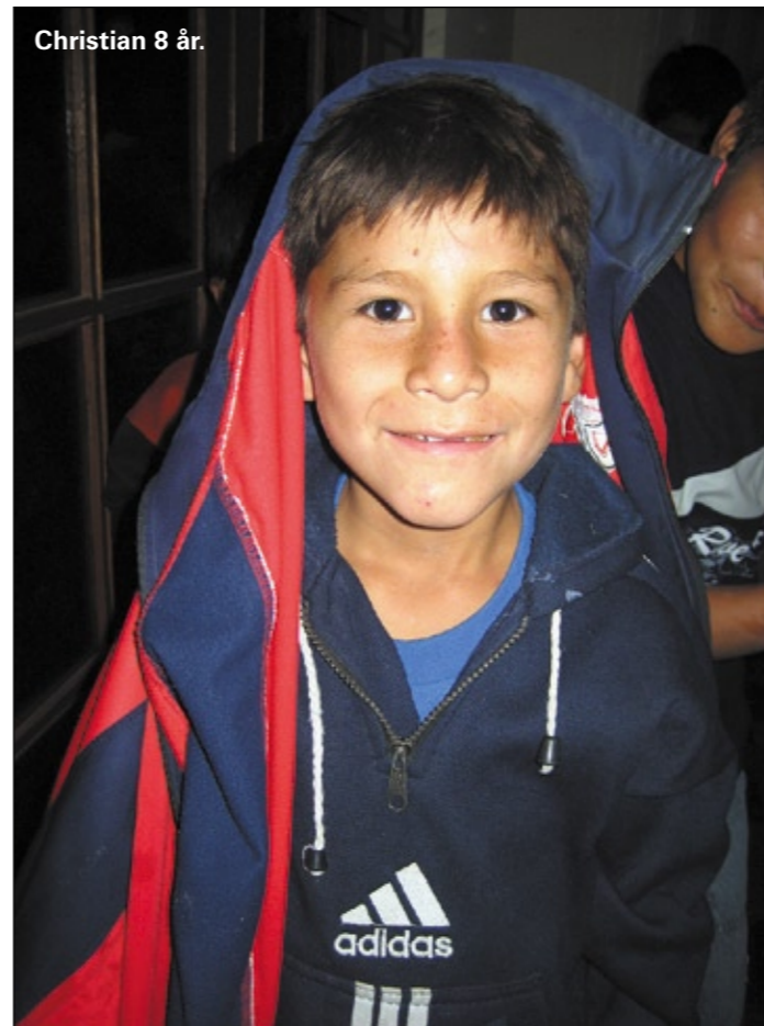
Christian 8 år.

I nästa nyhetsbrev kommer vi att berätta om det arbete vi utför bland barnen som finns på gatan.