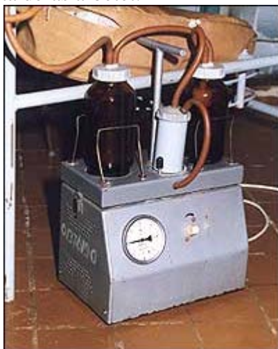
En sug för nyfödda